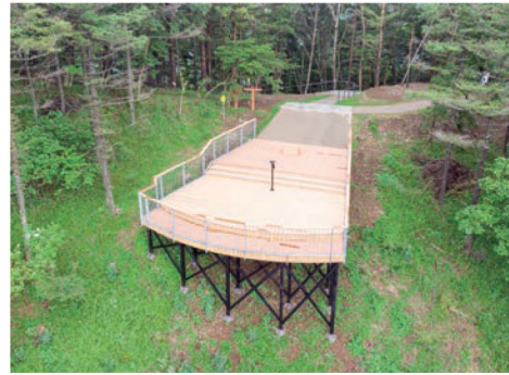
←ファーストテラス（下）と セカンドテラス（左）

階段を登りきると目の前にはセカンドテラスと富士山がお出迎え。 息が整ったところで東へ進んでみよう。3分ほど進むと先ほどの セカンドテラスより大きなファーストテラスに到着します。 天気良ければ写真のような絶景が待っています。